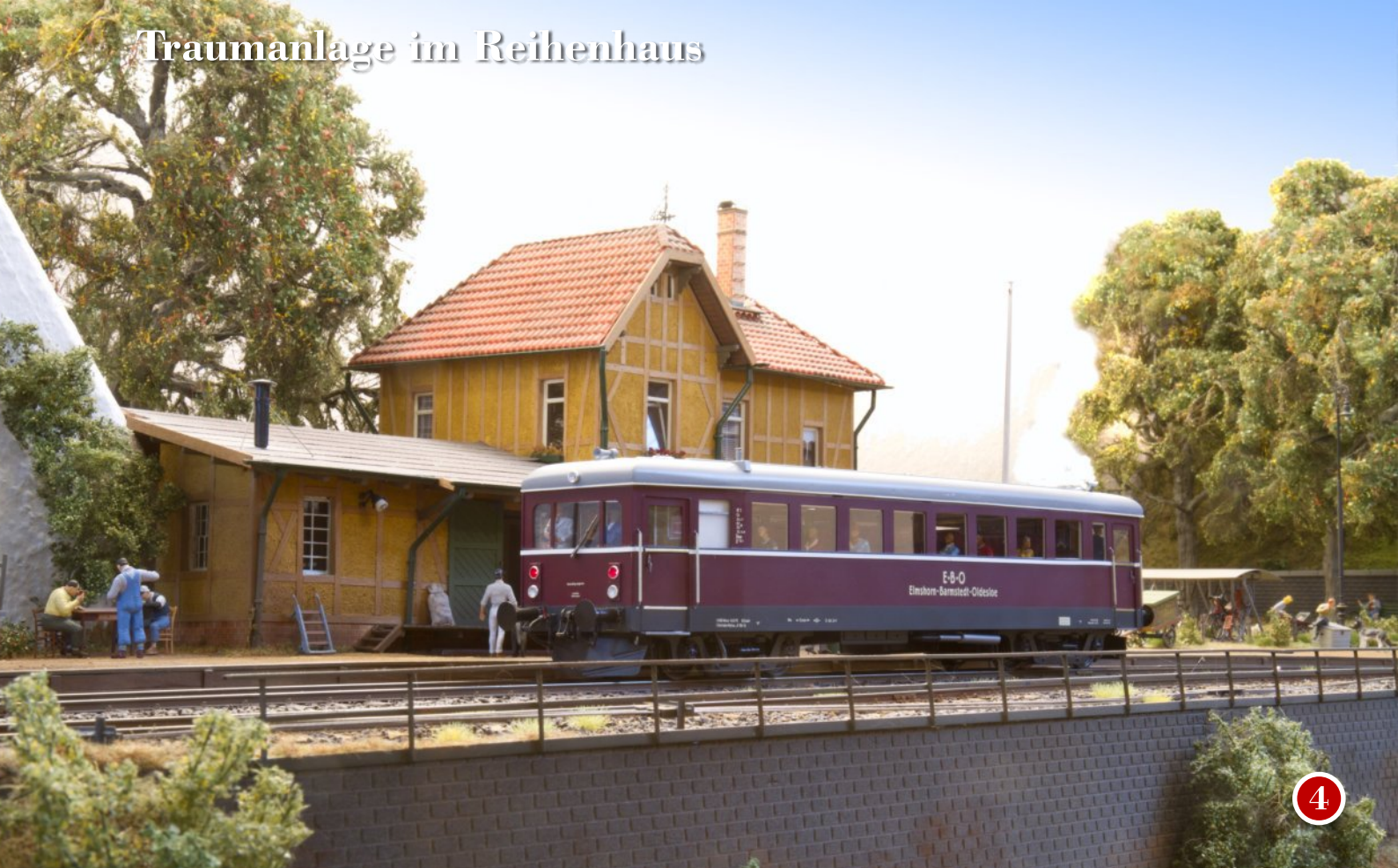
Oben: In Petershagen verkehren hauptsächlich Triebwagen, wie dieser Eigenbau des E.B.O., der Elmshorn-Barmstedt-Oldesloer Eisenbahn.