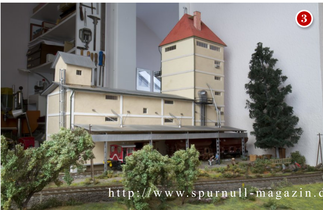
Das imposante BayWa Lagerhaus ist ein kompletter Eigenbau.

Aus Sylt kommen auch viele Bäume und Büsche: Heidekraut bildet das Astwerk, das dann mit Material von Silflor beflocht wurde. Die großen Fichten sind aus Messingstäben gebaut und mit Drahtästen versehen, auch hier kommt Silflor Material für die Nadeln zum Einsatz. Mit den Jahren hat sich gezeigt, welches Material für den dauerhaften Landschaftsbau am besten geeignet ist: Schaumstofflocken bröseln im Lauf der Zeit davon, aber das Silhouette Material hält jahrzehntelang, und sieht auch noch hervorragend aus.